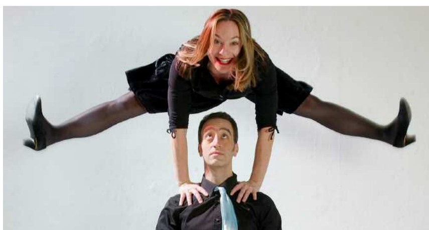
Divertimento domani con il Duo Full House

È possibile vincere due biglietti per la Piazza Grande, durante il Festival del film di Locarno 2016, partecipando al premio Gialli sui Laghi, con un racconto giallo inedito ambientato in una località di lago, redatto in lingua italiana, tra le 15'000 e le 30'000 battute, spazi compresi entro e non oltre il 25 agosto. Il racconto va inviato per e-mail a giallisulalaghiwva@gmail.com . Il testo vincitore verrà pubblicato sulla prestigiosa collana Giallo Mondadori e sarà premiato a Varese domenica 8 novembre.