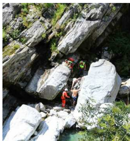
Soccorso fra le rocce

laboratorio di cucina per bambini e concorso di scrittura creativa), senza dimenticare due classicissime come la rassegna dell'Autunno gastronomico Lago Maggiore e Valli (dall'8 settembre al 18 ottobre, con la partecipazione di oltre 50 ristoranti) e la Festa delle castagne e Sagra d'autunno, che nei due weekend del 3 e 10 ottobre attira decine di migliaia di locali e turisti sul lungolago di Ascona. Il flyer con il programma dell'evento è disponibile agli sportelli dell'Organizzazione turistica Lago maggiore e Valli e può essere visionato sul sito www.cittadelgusto.ch .